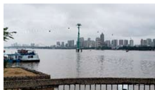
松花川より ハルビン市街を望む