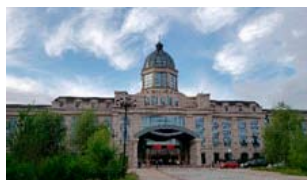
学会会場 (黒龍江太陽島ガーデンホテル)

永久磁石モータおよびドライブ(251件)、パワーコンバータ(111件)、再生可能エネルギー(87件)などの講演が、企画セッションではワイヤレスパワー伝送に関する講演が多数であった。