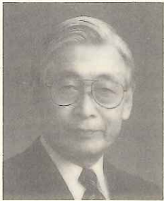
東北大学素材工学研究所