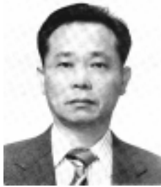
大阪大学大学院工学研究科